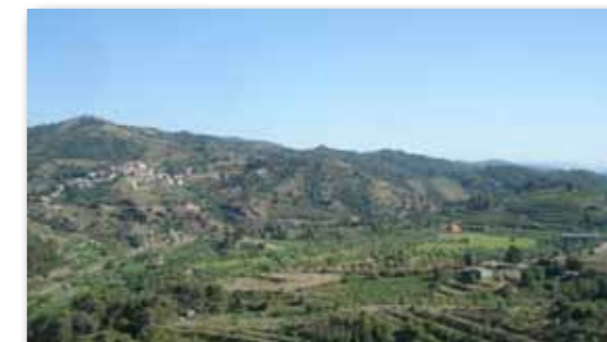
Los Plans en primer terme i, sota el poble, la Serra i la Vinya de la Vila, separades pel barranc dels Rucs