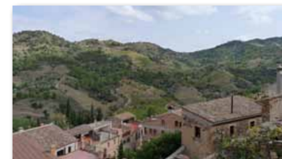
Les Saleres en primer terme i, al fons, los Solans i la Gigona