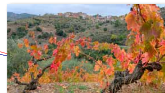
Torroja des de les Crivelles