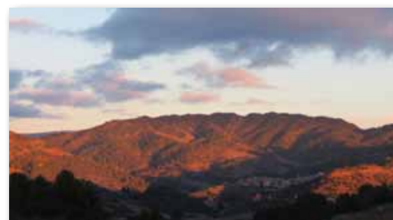
Les Estoses i els Figuerals