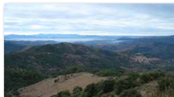
Torroja des de les Estoses