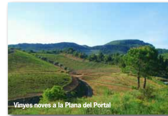
Vinyes noves a la Plana del Portal