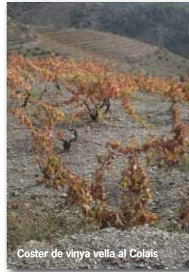
Coster de vinya vella al Colais

A la vegada, com sempre, us animem a que aporte el vostre coneixement per ampliar la toponímia i, si cal, també per rectificar-la, de manera que si creieu que podeu aportar més informació o esmenar algun aspecte que considereu erroni ens ho feu saber. Aquesta serà la millor manera d'anar perfilant el territori amb la major exactitud possible.