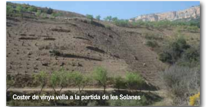
Coster de vinya vella a la partida de les Solanes