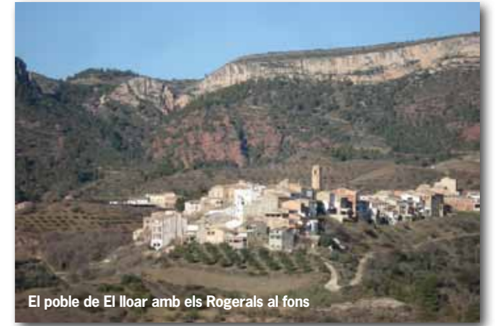
El poble de El lloar amb els Rogerals al fons